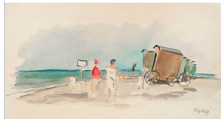
Joachim Rágóczy | Strandszene mit Badekarren | o. J. | Aquarell

Doch in seinen Arbeiten begleitet Rágóczy auch fasziniert die zunehmende Veränderung der Lebensweise durch den Badebetrieb der städtischen Sommergäste, die auf der Suche nach Ursprünglichkeit die Küstenregionen erobern. Ungebremst