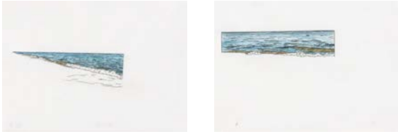
Tobias Rehberger (*1966), Seapieces , 1991, Aquarell und Farbstift

Wir leben auf einem »blauen« Planeten: Siebzig Prozent der Erdoberfläche wird von Meeren und Ozeanen bedeckt. Sie spielen eine zentrale Rolle für unser Klima und die Versorgung mit Nahrungsmitteln. Zugleich werden sie aber auch als Mülldeponie missbraucht, was selbst in entlegenen Gebieten wie der Isla Arena deutlich wird: Am Sandstrand dieses mexikanischen Biosphärenreservats wird tagtäglich angespült, was Menschen wegwerfen. Diese Flaschen, Glühbirnen oder Autoreifen hat Gabriel Orozco zu komplexen Installationen arrangiert, die sich als Zivilisationskritik, aber ebenso als poetische Topografie verstehen lassen.