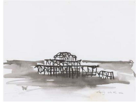
Fiona Tan (*1966), West Pier III , 2006, Tinte und Bleistift

20. Jahrhunderts zog das in einem opulent »orientalischen« Stil gestaltete Ensemble aus Pavillons und Konzertsälen alljährlich Hunderttausende Besucher an. Nach diversen Bränden und Stürmen ragt heute nur noch das Skelett der Gusseisenkonstruktion aus dem Meer. Auf Tans Bildern erscheint es wie ein Abgesang auf den einstigen Glanz des britischen Empire, das sich dank seiner zahlreichen Kolonien rund um die Welt erstreckte.