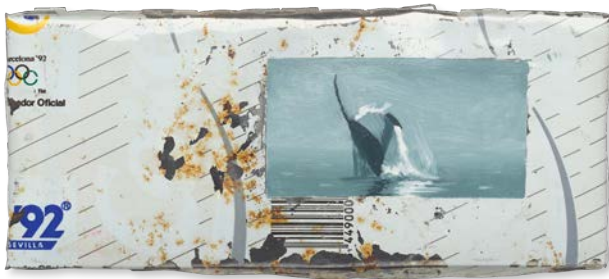
Peter Rösler (*1966), Wale (Detail), 1992, Öl auf Dosenblech

Mit Müll arbeitet auch Peter Rösler . Für seine Serie Wale bemalte der in Berlin lebende Künstler gewalzte Getränkedosen mit Buckelwalen. Das Bild des erhabenen Meeres Säugers, der seit langem zum Symbol für ein bedrohtes Ökosystem avanciert ist, lässt er mit den Dosen als einem Inbegriff für Zivilisationsmüll kollidieren. Symbolisch aufgeladen sind auch die Relikte des West Pier in der englischen Küstenstadt Brighton, denen Fiona Tan eine Fotoarbeit und eine Zeichnung gewidmet hat. Anfang des