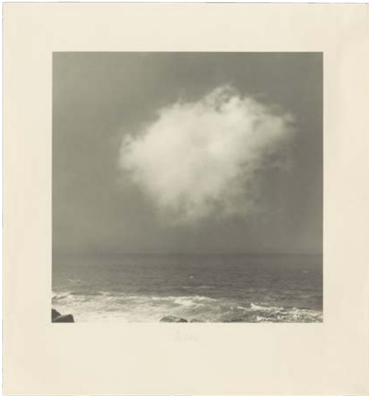
Gerhard Richter (*1932), Wolke , 1969/1971, Offsetdruck