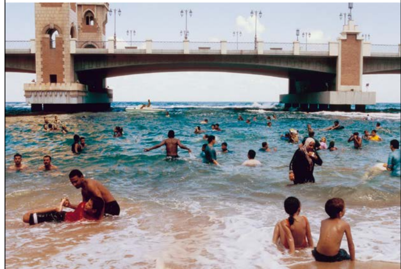
Maha Maamoun (*1972), Beach , o.J., Fotografie

20. Jahrhunderts zog das in einem opulent »orientalischen« Stil gestaltete Ensemble aus Pavillons und Konzertsälen alljährlich Hunderttausende Besucher an. Nach diversen Bränden und Stürmen ragt heute nur noch das Skelett der Gusseisenkonstruktion aus dem Meer. Auf Tans Bildern erscheint es wie ein Abgesang auf den einstigen Glanz des britischen Empire, das sich dank seiner zahlreichen Kolonien rund um die Welt erstreckte.