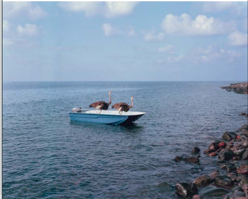
Paola Pivi (*1971), Ohne Titel (Strauße) , 2003, Fotografie