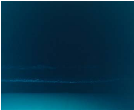
Annette Kelm (*1975), To a snail II-IV , 2003, Fotografie

Ein Straßenpaar steuert in einem Motorboot auf die Küste zu. Die beiden riesigen Vögel wirken wie erwartungsvolle Touristen, die gerade ihre Reise angetreten haben. Die surreale Szene ist nicht, wie man vermuten könnte, das Resultat digitaler Bildbearbeitung. Sie fand tatsächlich so statt – auf Alicudi, einer kleinen Insel vor Sizilien, wo die italienische Künstlerin Paola Pivi die beiden Vögel in Szene setzte. Das Meer dient ihr dabei als Kulisse für ein ebenso absurdes wie komisches Bild, das unseren Blick auf die Wirklichkeit hinterfragt. Dagegen zeigt Annette Kelms Fotoserie To a snail ein zunächst unspektakuläres Motiv – Wellen an einem nächtlichen Stand. Doch die atmosphärischen Aufnahmen entwickeln beim intensiveren Betrachten eine suggestive Kraft. Denn, so hat es die Autorin Florence Hervé