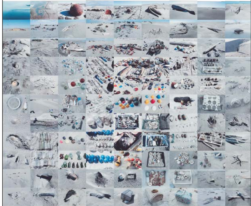
Gabriel Orozco (*1962), Sandstars , 2012, Fotografie

Wellen und Wolken changieren zwischen Banalität und Bedeutung, reiner Oberfläche und auratischer Aufladung. Wie Richter ist auch Doig ein Meister der Atmosphäre. Der auf Trinidad arbeitende Brite wird gerne mit Paul Gauguin verglichen. Doch seine geheimnisvolle Uferszene spricht weniger von einem exotischen Paradies, als vielmehr von der Unschärfe der Erinnerung, die so verschwommen ist, wie die Szenerie in der Ferne. Wesentlich nüchterner wirken Rehbergers Seapieces . Der Frankfurter Künstler nimmt hier den Ausdruck »Seestück« wortwörtlich. Auf seinen Aquarellen löst er sich formal vom tradierten Kanon des Sujets und zeigt einen isolierten Ausschnitt des Meeres – ganz ohne Himmel und Strand. Ähnlich reduziert auf das Wesentliche wirkt Thomas Bayrles Fotocollage. Seit den 1960er-Jahren setzt sich Bayrle immer wieder mit Massenkultur und -phänomenen auseinander. Meer, Strand und Urlauber lösen sich in seiner Arbeit Strand in geometrische Strukturen auf.